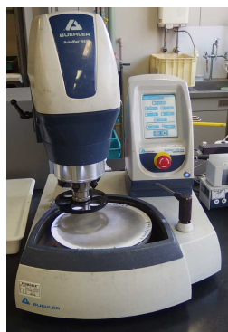
自動研磨装置 (平成21年度 JKA 補助導入)