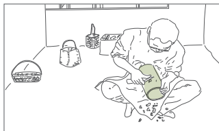
飯塚 泰 lizuka Tai

竹を切断したときの断面や、布ヤスリで磨き上げたときのしっとりとした手触りが好きです。竹を自分の意思に従わせるのではなく、竹の意思に従うような物作りをしたいと考えています。