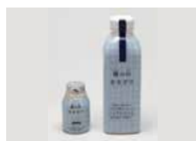
H28・29 ぶんご銘醸株式会社 極生タイプの甘酒「麴の杜あまぎけ」