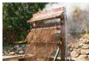
H17 株式会社ユーネット 竹製温泉冷却装置「湯雨竹」