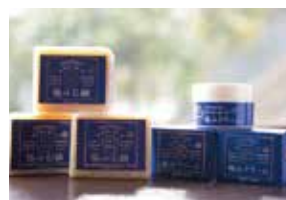
H27 有限会社 岡本屋 天然明礬とハーブの「極み石鹸・クリーム」