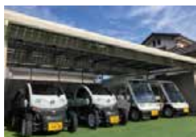
H24 T・プラン株式会社 太陽光発電EV充電システム「青空コンセント」