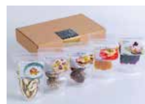
H30 株式会社姫野一郎商店 手軽に選べる椎茸のパーソナルギフト