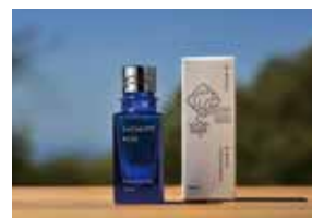
H30 株式会社グリーンエルク エッセンシャルオイル「ユーカリブルー」